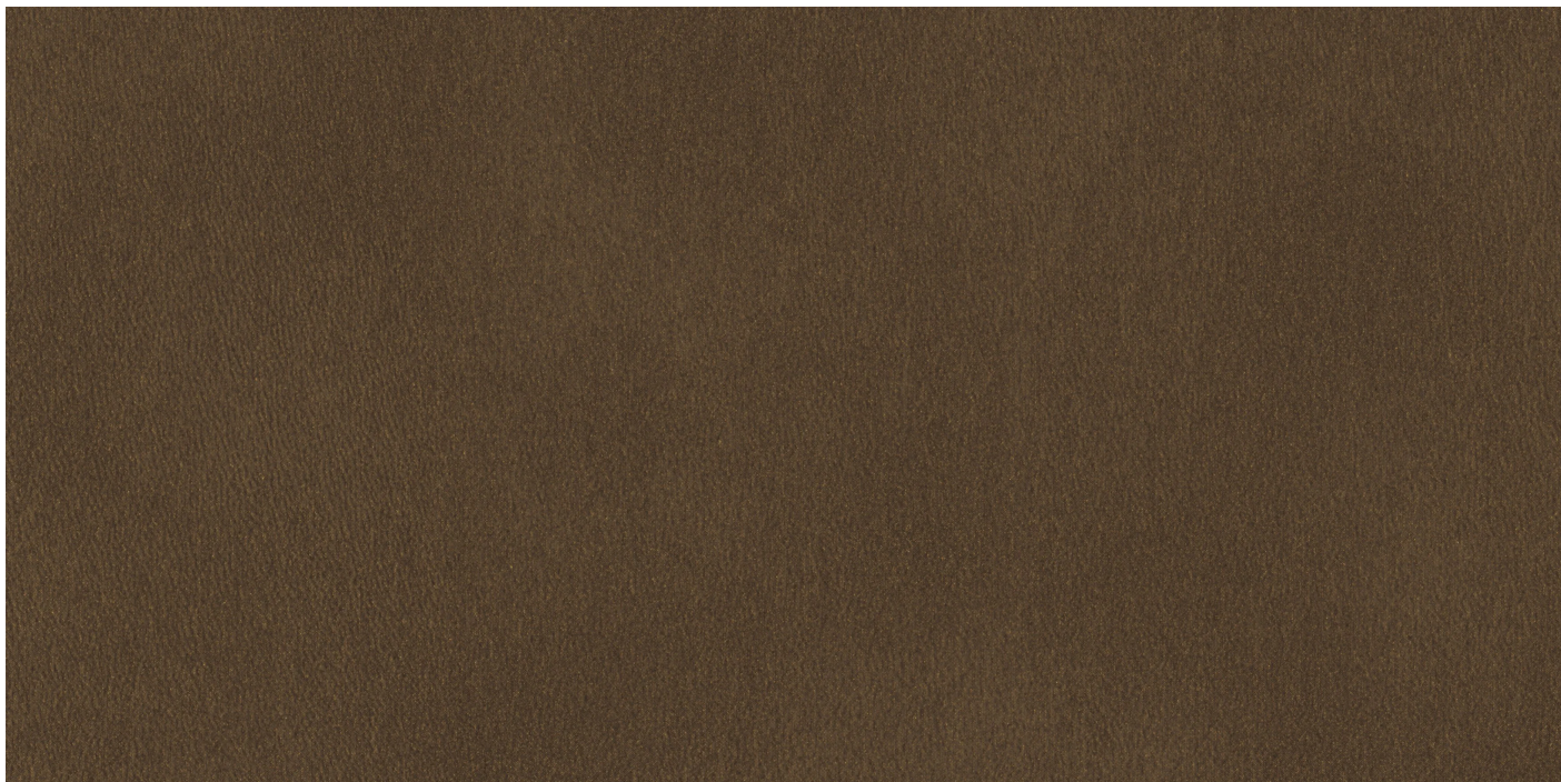
NAB8972 MARRON DORÉ

Kolor na ekranie może się różnić od oryginału. | 1 cm |